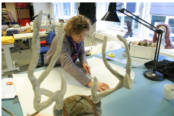
Skrædderen i gang med at tegne kostumedesigns

Efter forestillingen bliver kostumerne vasket og rensat. Så bliver de hængt op i kælderen til senere brug. De kostumer, vi har lånt os til, returneres.