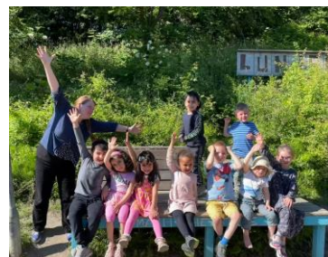
Dansepædagog & børn i projekt Frydenlund

Tilskuddet muliggjorde også, at vi kunne nedbringe ventelisterne på vores meget efterspurgte sommerferieaktiviteter. Filuren deltager altid i kommunens "Aktiv Sommer"-tiltag, hvor børn og unge får mulighed for at afprøve teater og dans. For vores vedkommende er sommerferieaktiviteterne en god mulighed for at give børn og unge en kompakt