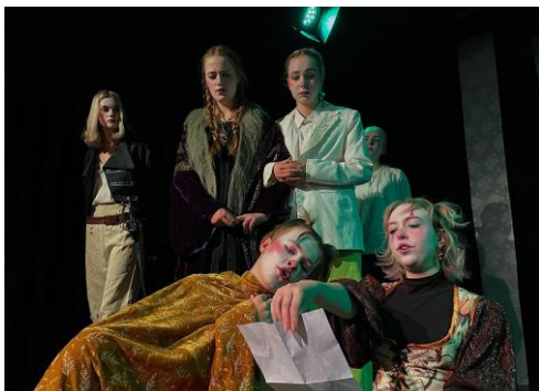
Årets Klassiker, helårshold i Kulturskolen

Således blev der som i de foregående sæsoner udbudt "ren" danseundervisning for alle aldersgrupper fra 4-14+, og dertil i løbet af sæsonen 3 "dansensteater"-hold, som vi havde succes med for en årrække siden. Det kan være sværere at finde undervisere med både drama- og dansefaglighed af tilstrækkelig høj kvalitet, og derfor er det ikke givet, at tilbuddet kan indgå fast i repertoiret, men for nu har vi 1-2 timelærere i staben, som kan klare opgaven med stor dygtighed.