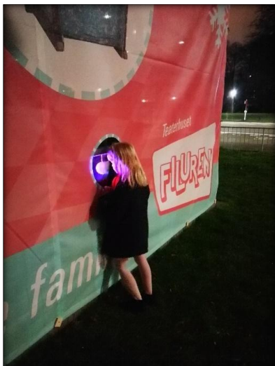
Et kig ind i en åbnet låge efter en premiere.