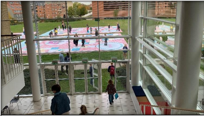
Publikum i gang på spillepladen efter forestilling.

brætspillene i megastørrelse og spændt 3 stk. ud på græsarealet mellem Musikhuset og ARoS, så familiepublikummet efter forestillingen i Corona-sikker afstand kunne lege og spille sig gennem forestillingens spørgsmål og tematikker. Spillene var en stor succes både for publikum og for dem, der stødte til legen, da de naturligt kaldte på nysgerrig opmærksomhed fra forbigående og fra ARoS' top og "Regnbuen".